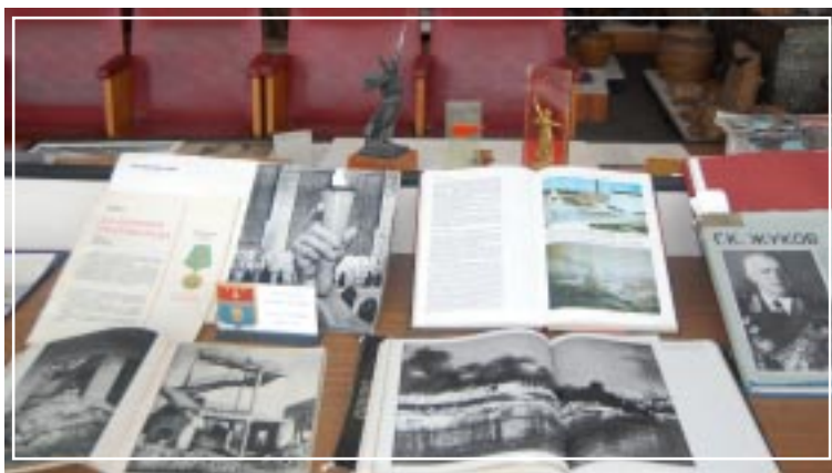
Делегация Фировской школы в Волгограде в 1974 году

ленном Сталинграде я не был. С фронтовыми товарищами связь прервалась. Но я всегда помню, как мы вместе с бойцами как кроты зарывались в норы в балках, в окопах даже не всегда солома была