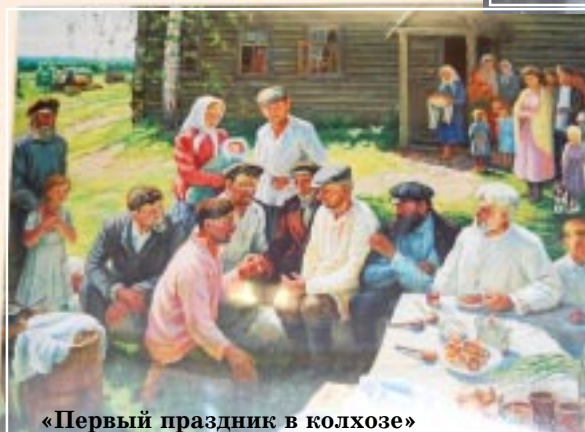
«Первый праздник в колхозе»