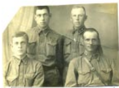
1-й батальон 1-й кавалерийской дивизии. 1942 г.

В ноябре 1942 началось наступление на Сталинград.