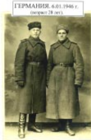
ГЕРМАНИЯ. 6.01.1946 г. (срок 28 лет).