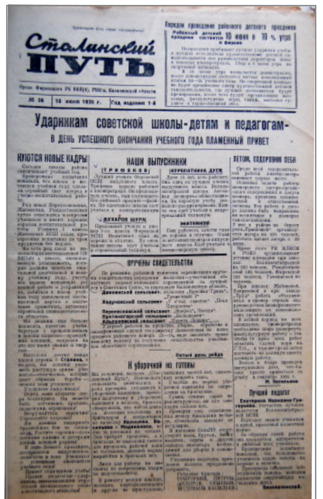
Этот номер районной газеты вышел в свет 80 лет назад – 10 июня 1935 года

Жители близлежащих колхозов "Ударник" с центром в п. Фирово и