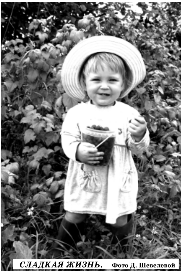
СЛАДКАЯ ЖИЗНЬ.