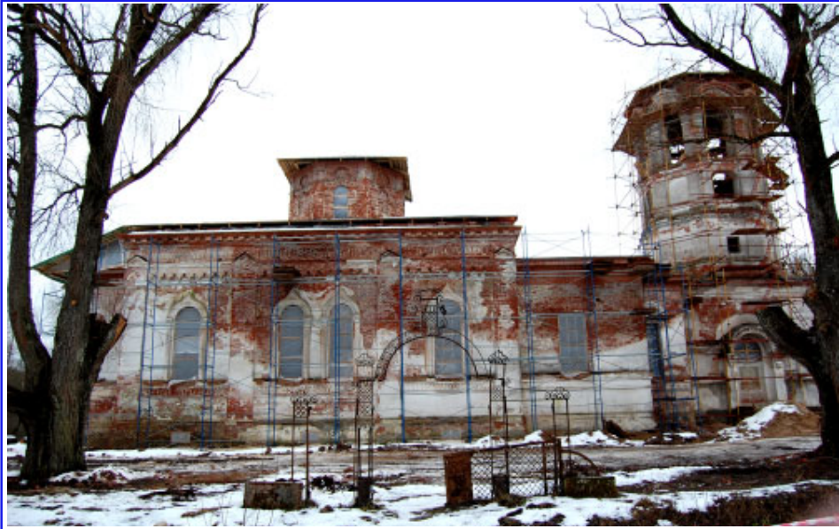
Восстанавливается храм Параскевы Пятницы в д. Домкино

Рождение в мир Спасителя – одно из самых значимых событий, повлиявших на историю всего мира. Возможно ли остаться равнодушным, когда Церковь молитвенно призывает каждого: "Христос рождается, славите!". Славите вместе с ангелами, славящими Его в ночь Рождества. "Христос с небес, встречай-