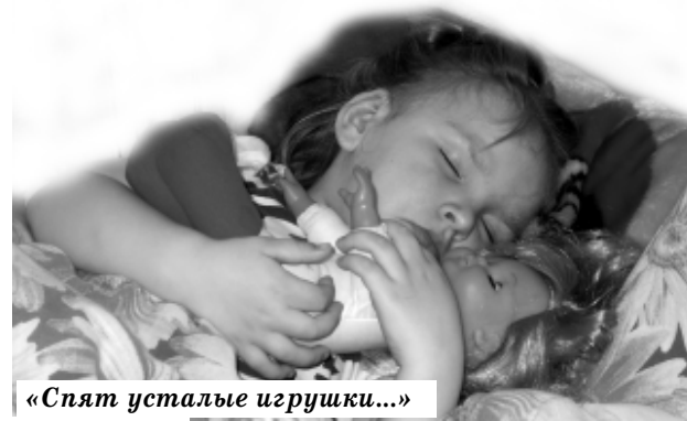
«Спят усталые игрушки...»

Если у вас есть интересные, забавные или сюжетные фото – поделитесь с нами! И сможете увидеть их на страницах "Коммунара". А еще можно сделать фото-конкурс на любую. Пишите нам, присылайте ваши фото, предлагайте темы.