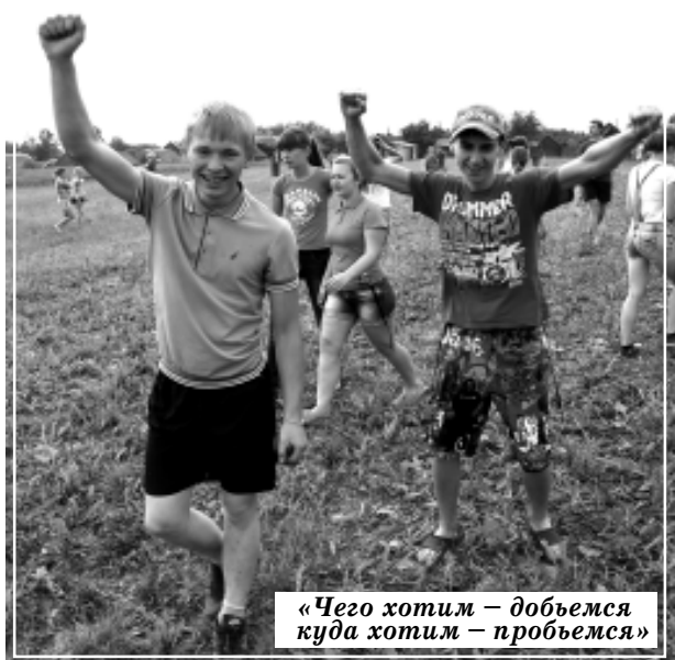
«Чего хотим – добьемся куда хотим – пробьемся»