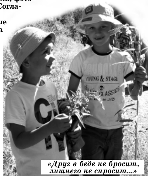
«Друг в беде не бросит, лишнего не спросит...»