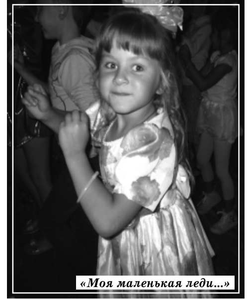
«Моя маленькая леди...»