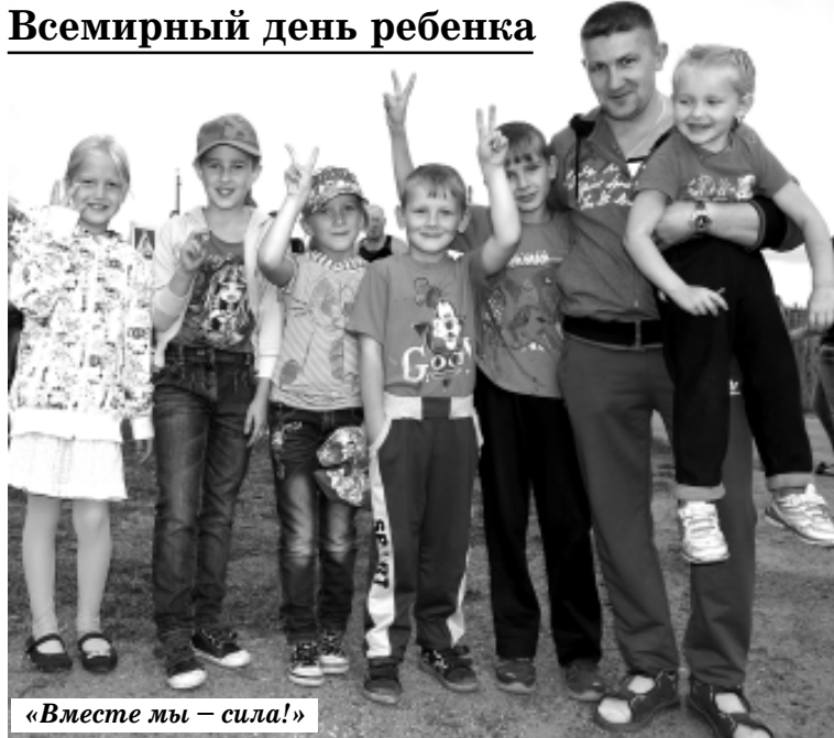
«Вместе мы – сила!»

Все знают о Международном дне защиты детей – 1 июня, этот праздник прижился в России. А 20 ноября отмечается Всемирный день ребенка. Праздник был приурочен к "Конвенции о правах ребенка", которая вступила в действие в 1990 году, а в России – 1994 году.