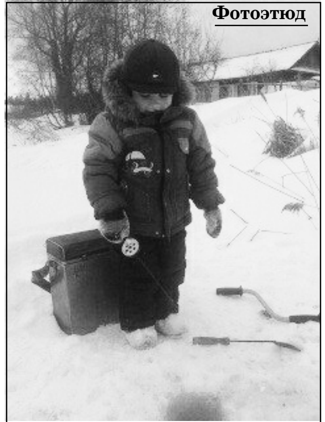
«Клевать, я сказал!».