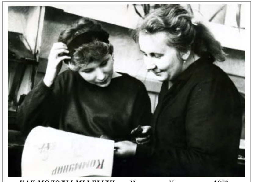
КАК МОЛОДЫ МЫ БЫЛИ... Из архива «Коммунара», 1989 год