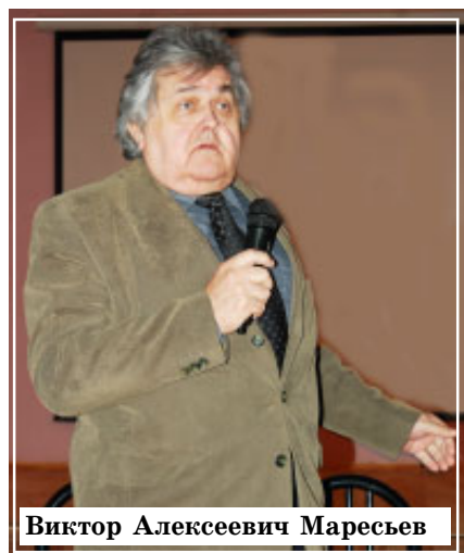
Виктор Алексеевич Маресьев