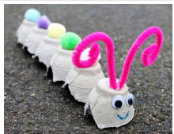
Страницу подготовила Ольга ПЕТРОВА