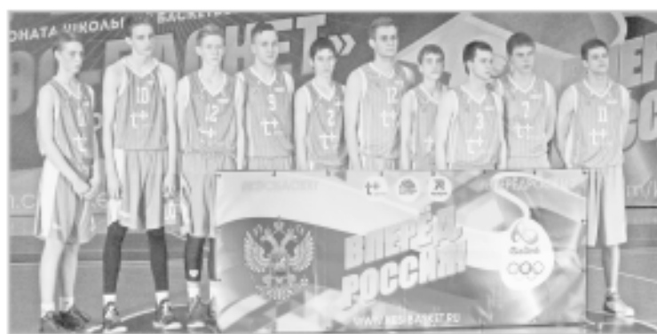
От областных соревнований – к новым вершинам

Команды, занявшие первое и второе места, будут представлять наш регион на соревнованиях Центрального федерального округа, которые пройдут в марте.