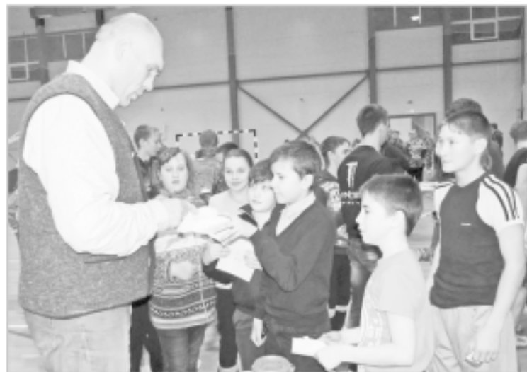
От желающих пообщаться с Валуевым не было отбоя

Высокого в буквальном смысле гостя (рост Николай Валуева 213 см) встречали сандовским медом и яблочным пирогом.