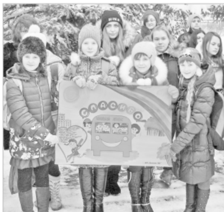
Ученики Михайловской школы рады новому автобусу

В прошлом году 28 сельских школ из 17 районов Тверской области обновили свой автопарк. Из областного бюджета на эти цели потрачено более 41 миллиона рублей. Работа по модернизации школьного автопарка Верхневолжья будет продолжаться – в 2016 году запланировано приобретение еще 34 автобусов – ПАЗов и ГАЗелей.