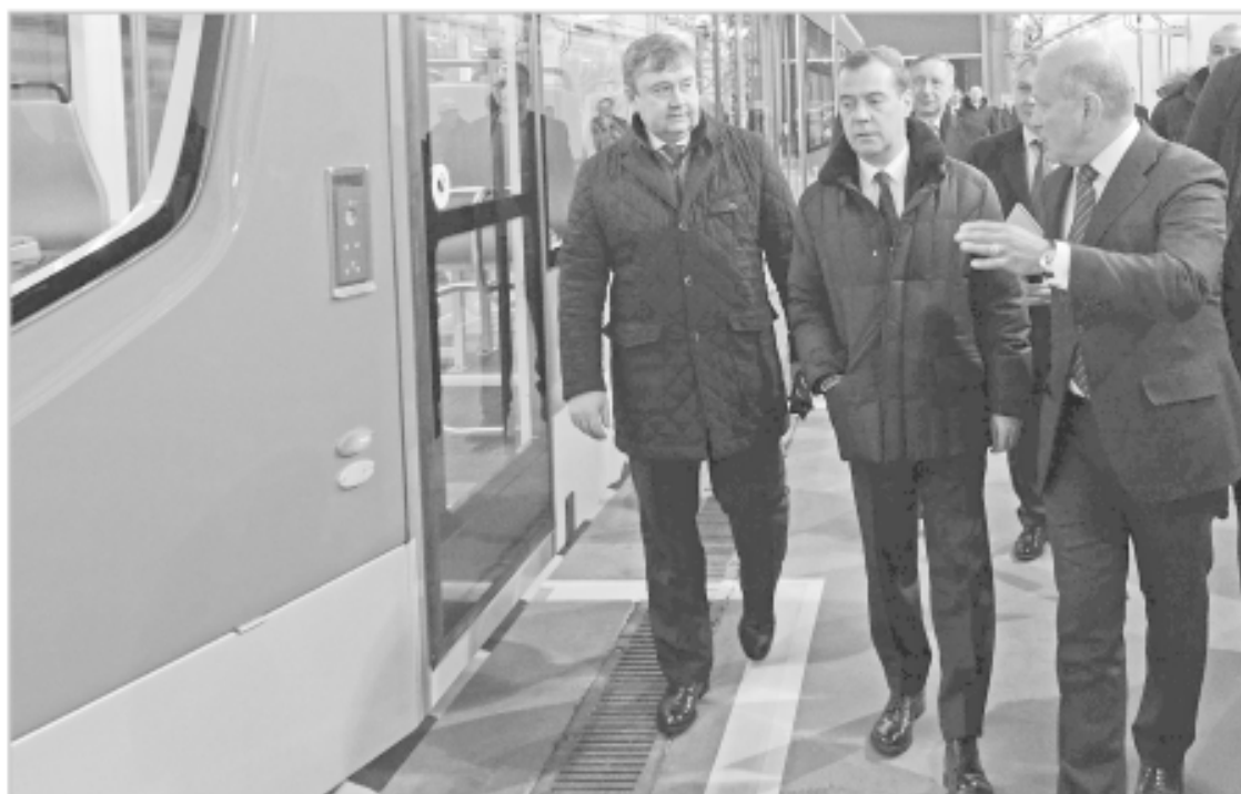
Дмитрий Медведев лично оценил новую продукцию Тверского вагонзавода