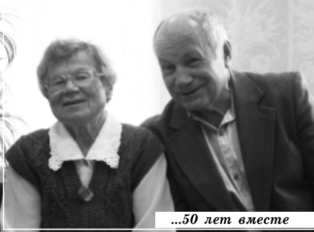
...50 лет вместе

Двадцатого марта отмечается не привычный для нас, но очень хороший праздник: Международный день счастья. Впервые он был провозглашен в 2014 году Генеральной ассамблеей ООН. Никакой политической или событийной истории он не имеет, просто в этот день можно и нужно отбросить весь негатив, вспомнить самое лучшее, что было, есть и будет в жизни. Улыбнуться, пожелать всем добра, обнять своих близких и сказать им о своей любви. И будет вам счастье!