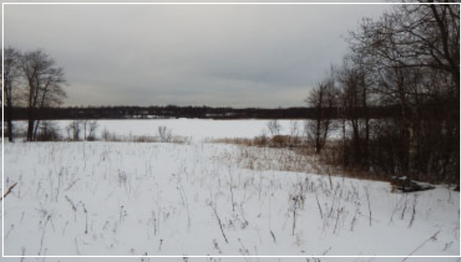
«Тишина на Граничном». Фото В. Степановой, д. Ходуново, номинация «У леса на опушке». «Веселая компания», фото д/с «Белочка» п. Великооктябрьский, номинация «А у нас во дворе».