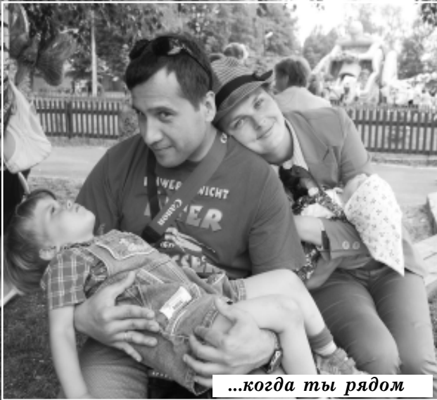
...когда ты рядом