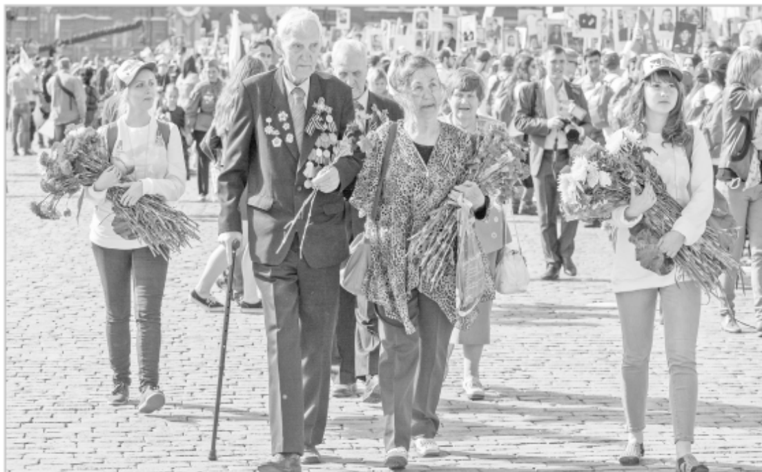
Акции всероссийского масштаба «Бессмертный полк» и «Георгиевская ленточка» пройдут во всех муниципалитетах Верхневолжья

Тверская область – единственная в ЦФО, выделившая в этом году средства на восстановление и ремонт воинских захоронений