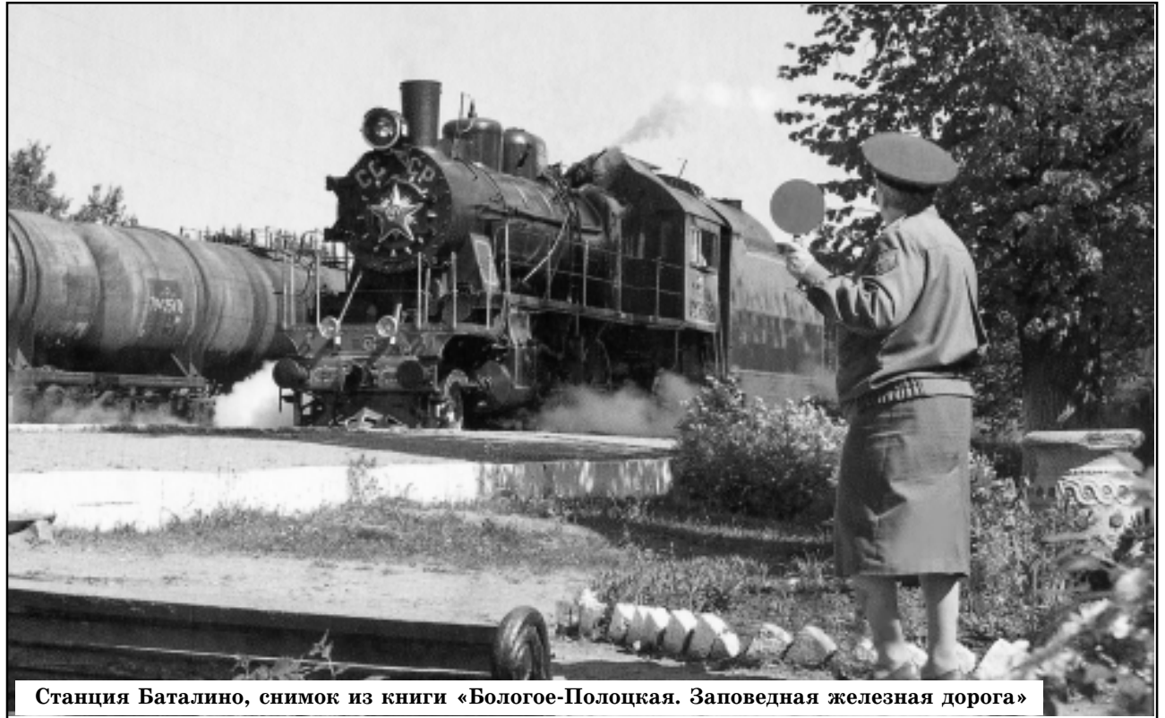
Станция Баталино, снимок из книги «Бологое-Полоцкая. Заповедная железная дорога»

доподъемные машины в соответствующих зданиях, где были и помещения для дежурного машиниста. В Фирове машинисты воду старались не брать (жесткая!) – предпочитали заправиться в Баталине. Вода поступала из реки Граничная по подземным трубам длиной в три километра.