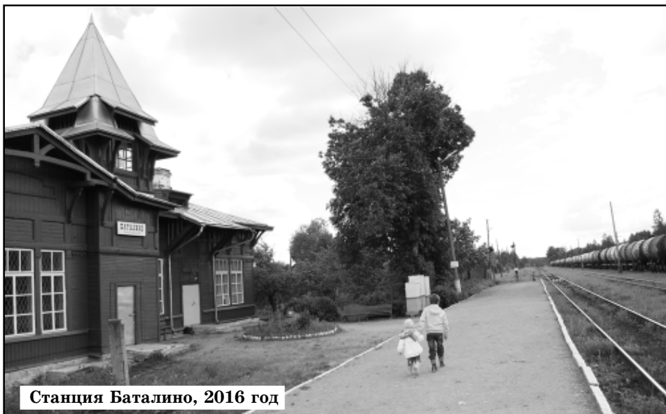
Станция Баталино, 2016 год

Ветеран-паровозник из Осташкова, всю жизнь водивший поезда по Бологое - Полоцк, рассказывал: "Бомбили каждую поездку, и не раз. Когда начиналась бомбежка, мы сразу останавливались. Не слушай, будто бы машинисты маневрировали под самолетом: это чепуха! Куда нам с самолетом тягаться? Если встанешь, поезд можно сбросить хотя бы частично. А если бомбой врежет на ходу - весь состав под