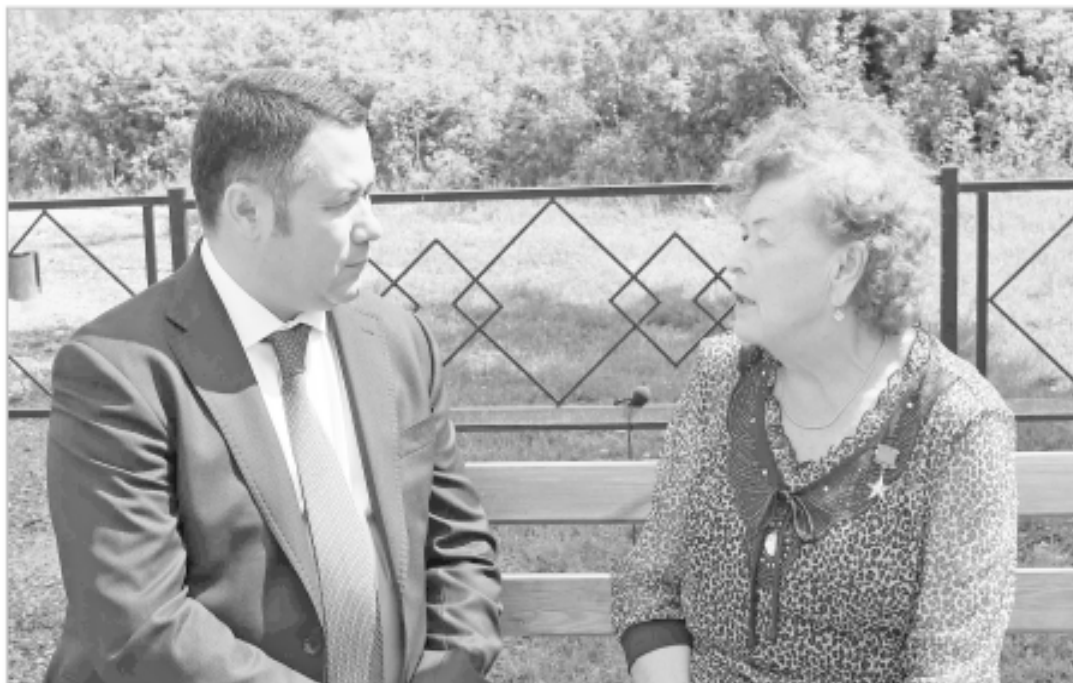
Зажатко, что Игорь Руденя использует многочисленные встречи в муниципалитетах не для агитации, а для решения конкретных проблем конкретных людей

Интересно, что, рассказывая о работе областного Правительства, Игорь Руденя говорит «Мы решили», «Мы посетили», «Мы добьемся»... Это даже немного режет слух, ведь раньше нам в течение нескольких лет заявляли: «Я сказал», «Моя область», «в МОЕМ регионе». Исполняющий обязанности губернатора не использует «барскую» риторику. Но вроде бы и не прячется за словом «Мы» от личной ответственности. Скорее, подчеркивает, что правительство настроено на командную работу – совместно с районными властями, общественными