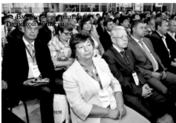
Вместе – за развитие Тверской области

Таков лейтмотив IX Собрания депутатов представительных органов Тверской области, которое прошло на большой арене спорткомплекса "Орбита".