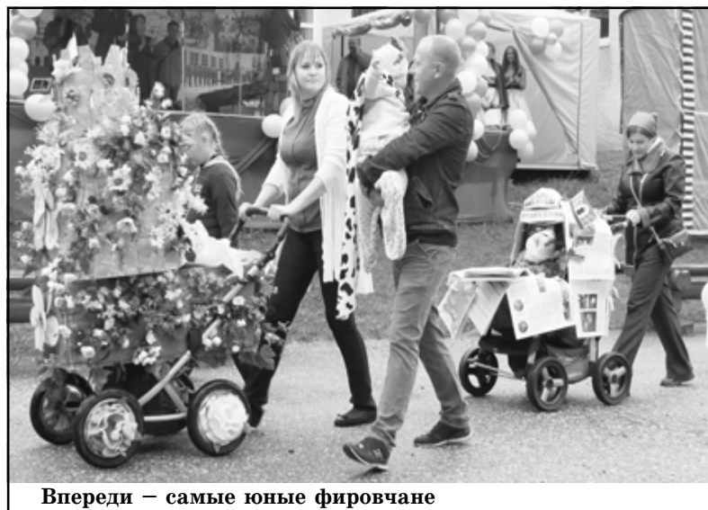
Впереди — самые юные фировчане

P.S. О других фрагментах праздника читайте в следующем номере нашей газеты.