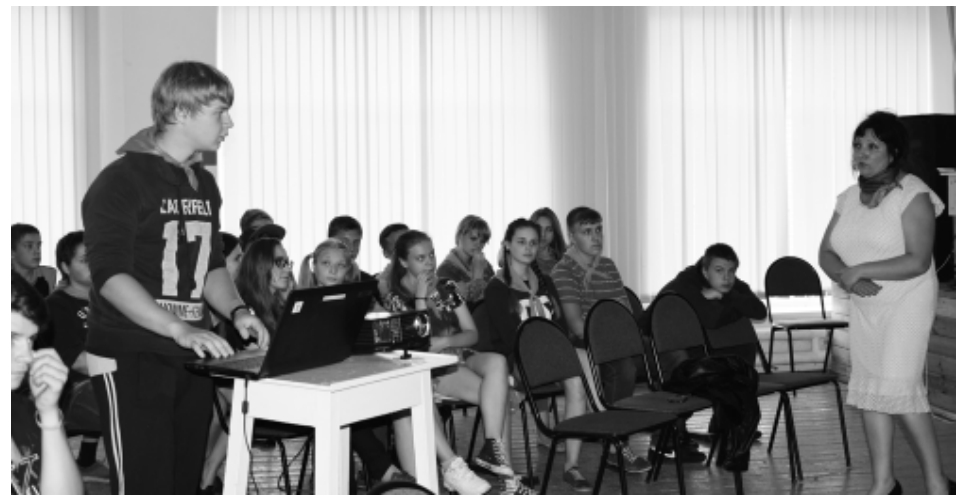
Пенсионный фонд: вопросы и ответы

Психологическая игра "Убить дракона" для многих стала самым ярким впечатлением не только этого дня, но и всей смены лагеря. Сложнейшие жизненные ситуации, в которых было необходимо сделать выбор, воспринимались молодым поколением очень реально и эмоционально.