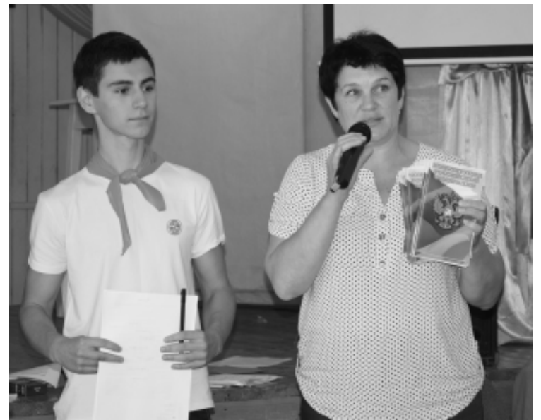
Практикуемся в знании избирательного законодательства

Четвертый день – расставательный... У многих ребят уже с утра была печаль на лице (или в глазах). Уж очень не хотелось уезжать. Ситуацию исправил демонстрация навыков, полученных на занятиях Школы лидера. Ребята подготовили различные проекты: танцевальной, игровой, литературной и психологической направленности. Затем "подсластила" настроение спортивная игра "Олимпиада-2016" – в ней три отряда ярко и образно представляли спортсменов из Индии, Бразилии, Японии. Пришлось посостязаться