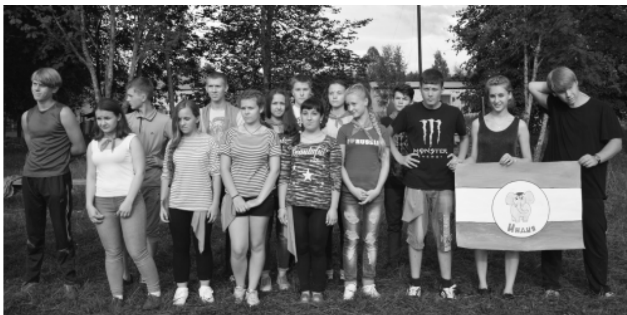
Строится команда. Наша летняя олимпиада