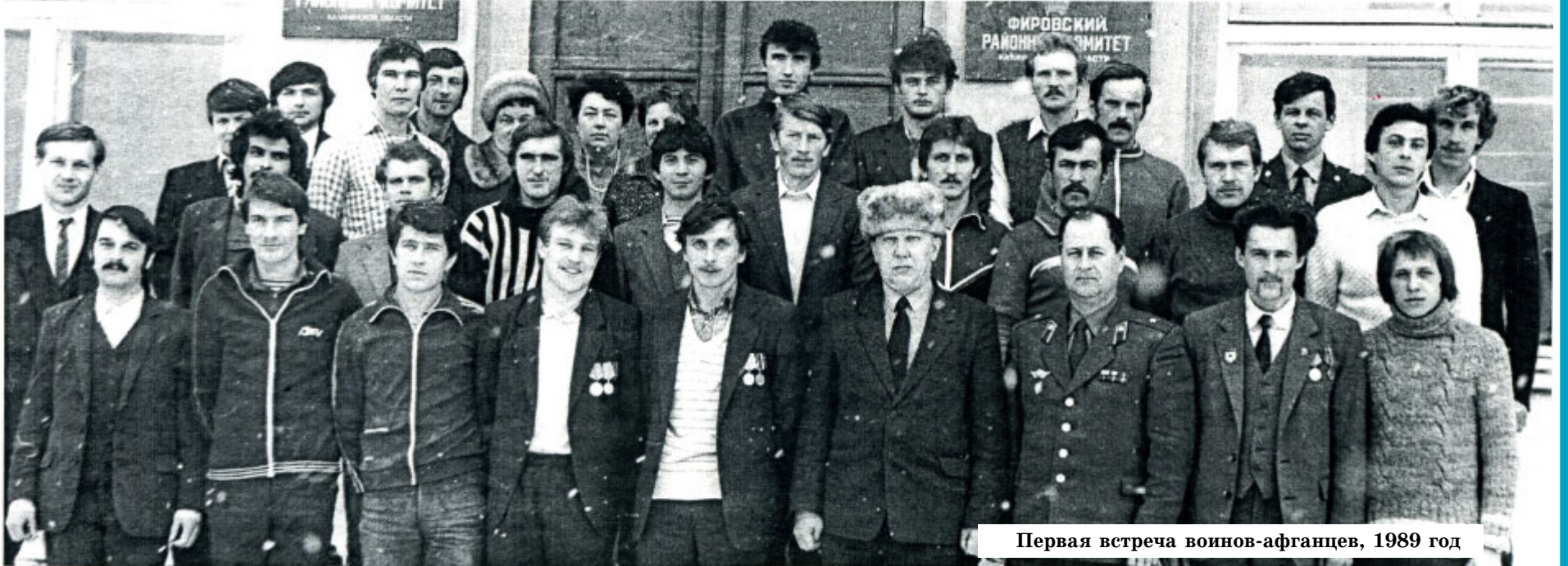
Первая встреча воинов-афганцев, 1989 год

Вывод советских войск из Афганистана был завершён 15 февраля 1989 года. Эта дата сейчас отмечается в России как День воинов-интернационалистов, участвовавших в урегулировании военных конфликтов на территории ближнего и дальнего зарубежья. В нынешнем году исполнится 25 лет со дня вывода контингента советских войск из Афганистана.