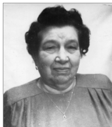
1997 год: не стареют душой ветераны

Но они выстояли. И, прежде всего, духом своим. Восстанавливали разрушенное, создавали семьи, растили детей, всегда верили в лучшее будущее. Только благодаря им мы живем в этом мире!