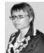
Страницу подготовила Ольга ПЕТРОВА

Теперь на территории нашего района нет ни одного предприятия, где можно было бы пошить или отремонтировать одежду. Хорошо, что портные, работавшие на предприятиях бытового обслуживания, не отказывают в помощи: всегда вошьют молнию, убавят длину, сошьют изделие. А как хотелось бы иметь цех по ремонту и пошиву одежды в нашем районе! Он очень необходим фировчанам.