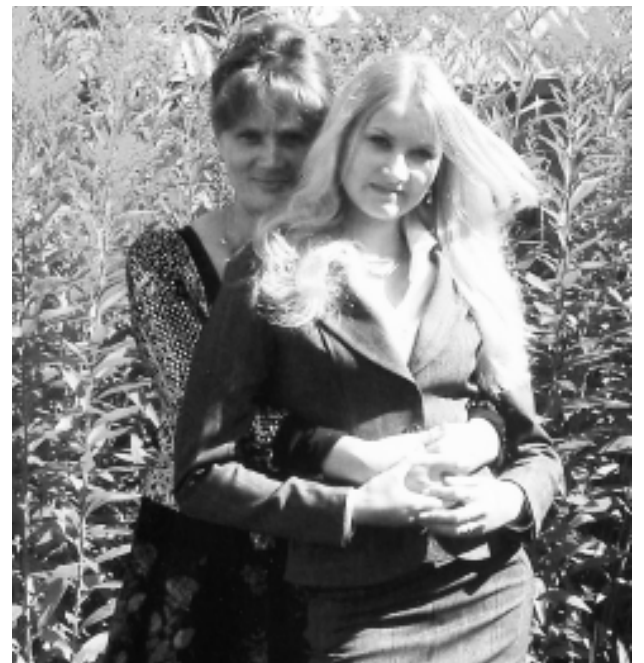
С любимой дочкой.

За сорок минут, что я пробыла в кабинете, в архивный отдел поступило несколько звонков, обратился за готовой справкой мужчина, пришла просить помощи женщина. К слову, в последние два года граждане обращаются сюда за документами, которые требуются при оформлении земель. Сельским жителям нужны документы для подтверждения права на дом. Далее по количеству запросов лидируют архивные справки о работе и заработной плате. Интересный факт: самыми редкими являются обращения по предоставлению информации о своих прабабушках, прадедах или кого-нибудь из родственников, живущих когда-то в нашем фировском крае. Правнуки интересуются своими корнями, желают воссоздать генеалогиче-