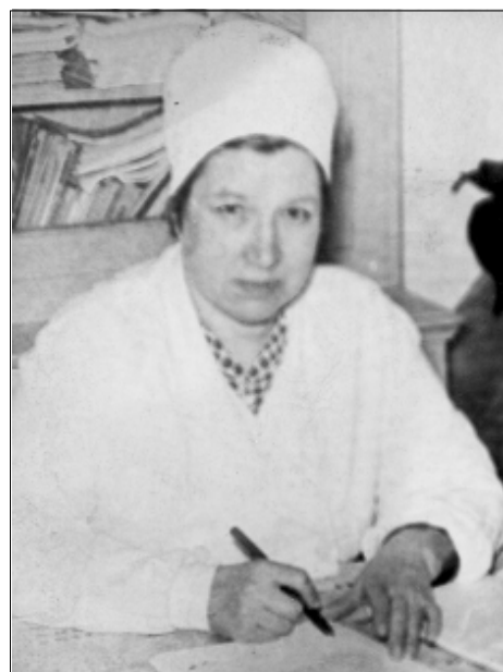
1971 год: время работы в Баталинском санатории