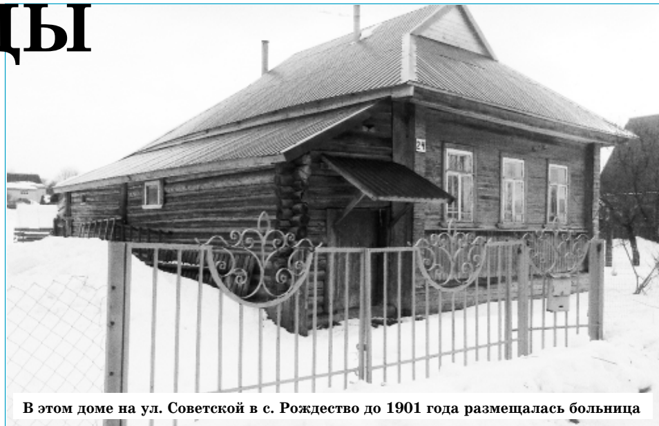
В этом доме на ул. Советской в с. Рождество до 1901 года размещалась больница

Война – это не только пули, снаряды, бомбы, мины на полях сражений. Немало людей умер-