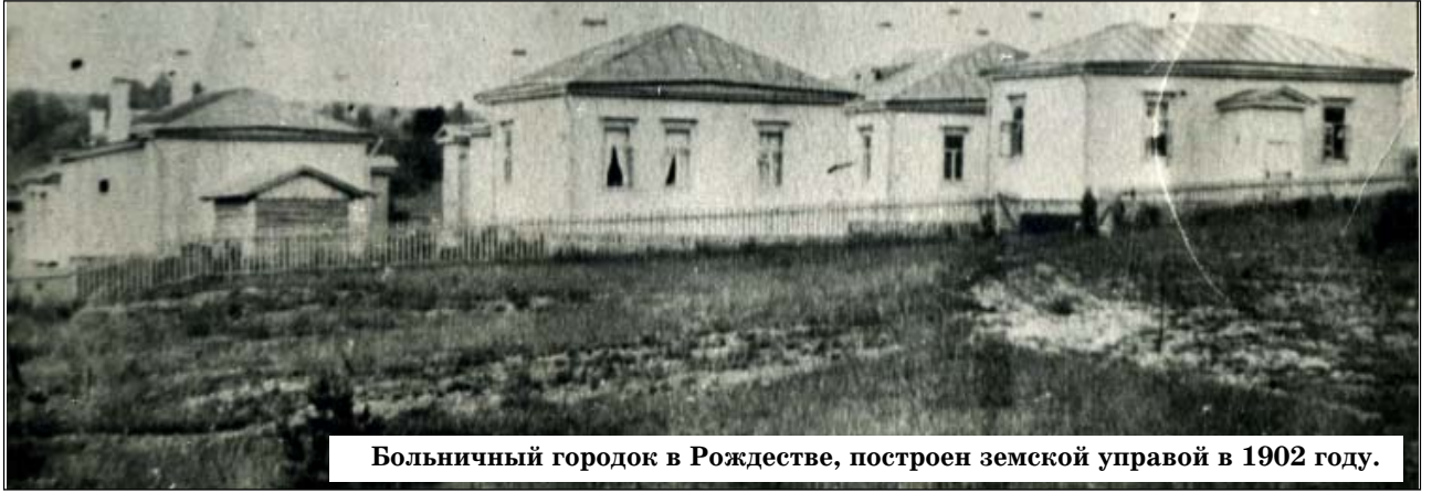
Больничный городок в Рождестве, построен земской управой в 1902 году.