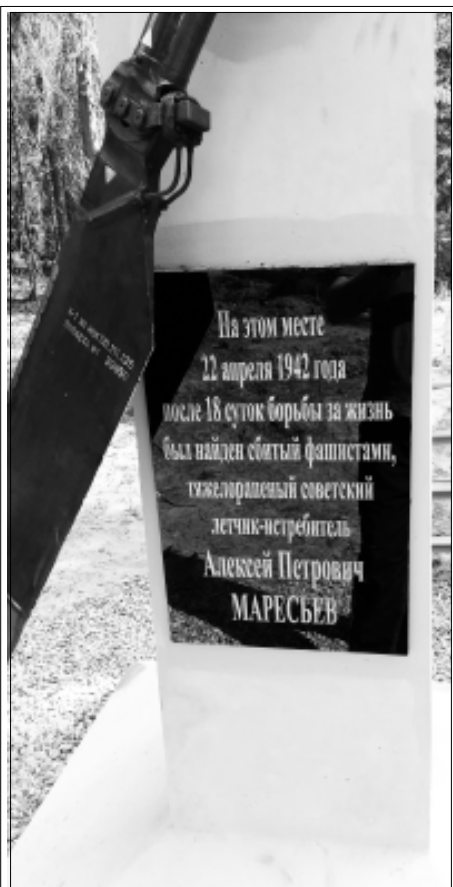
Памятный знак на месте, где нашли Алексея Маресьева