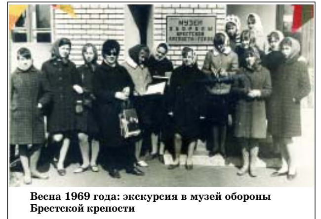
Весна 1969 года: экскурсия в музей обороны Брестской крепости