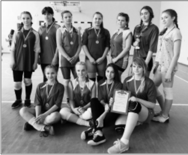
По окончании всех игр команды Рождественской СОШ были награждены памятными кубками, грамотами и золотыми медалями.

В первенстве среди средних школ Фировского района, которое прошло 13 апреля в спортивном зале РДК п. Фирово, приняли участие две команды юношей и три команды девушек в возрасте 14-17 лет из Рождественской и Фировской общеобразовательных школ.