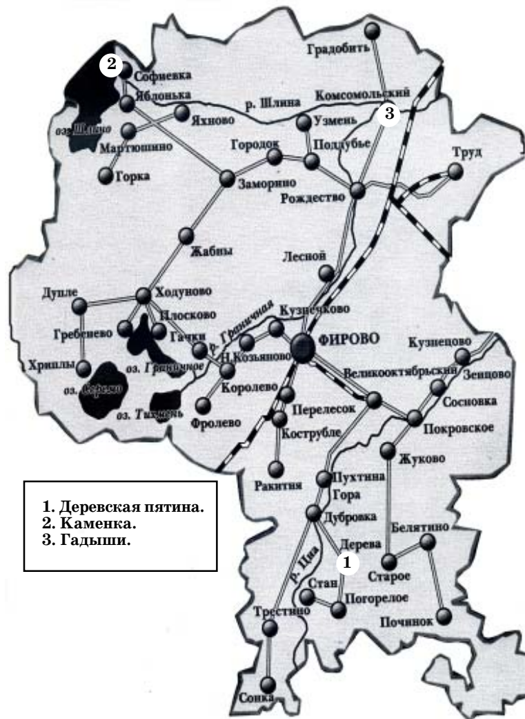
1. Деревская пятина. 2. Каменка. 3. Гадыши.

Дальнейшее развитие Гадышей связано с заводом. В годы НЭПа на берегу реки Шлина предприниматель Як, проживающий в городе Вологое, организовал лесопилку. Это был небольшой дощатый навес с маленькой лесопильной рамой. Приводом к этому станку служил паровой локомотив, который топили дровами и отходами от производства. Лес для распиловки доставляли сплавом по реке Шлина. Готовые доски вывозили на лошадях на станцию, где грузили на платформы. Все работы производились вручную. Основную часть пиломатериалов — доски, горбыли, брус покупали крестьяне из окружающих деревень. Рабочие были сезонные, жили рядом в сколоченных бараках. В начале 30-х годов заводик этот у Яна был отобран.