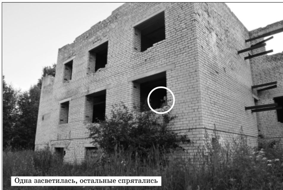
Одна засветилась, остальные спрятались