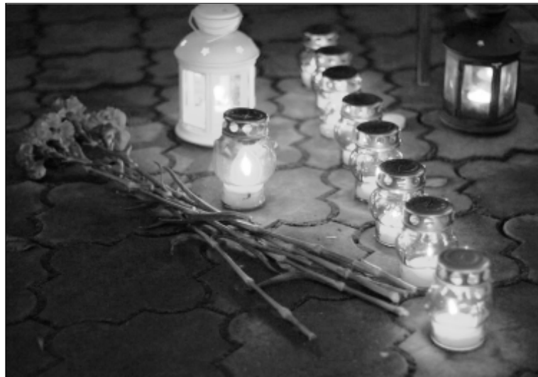
Давайте вспомним людей, ставших жертвами политических репрессий. Свеча памяти – свет надежды на то, что подобное не повторится.