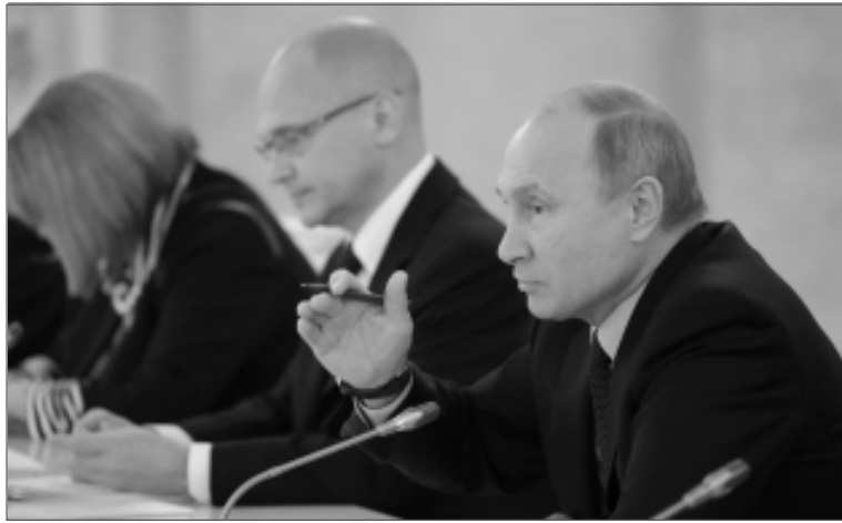
Подпись: Владимир Путин отметил, что повышение позиции России в международном рейтинге деловой активности — очень позитивная тенденция

Безусловно, важно понимать, что творится в мире, как наша страна реагирует на международные угрозы и как страны Запада реагируют на президента Владимира Путина, давно признанного мировым лидером, с которым невозможно не считаться. На Россию пытаются оказать давление санкциями, не однажды забугорные деятели разыгрывали возможность разыграть у нас "оранжевую" революцию по грузинскому или украинскому сценарию. Но последовательная, твердая, а местами и жесткая политика, которую проводит наш президент, позволяет сохранить социальную стабильность в стране и справляться с последствиями экономического кризиса, который, кста-