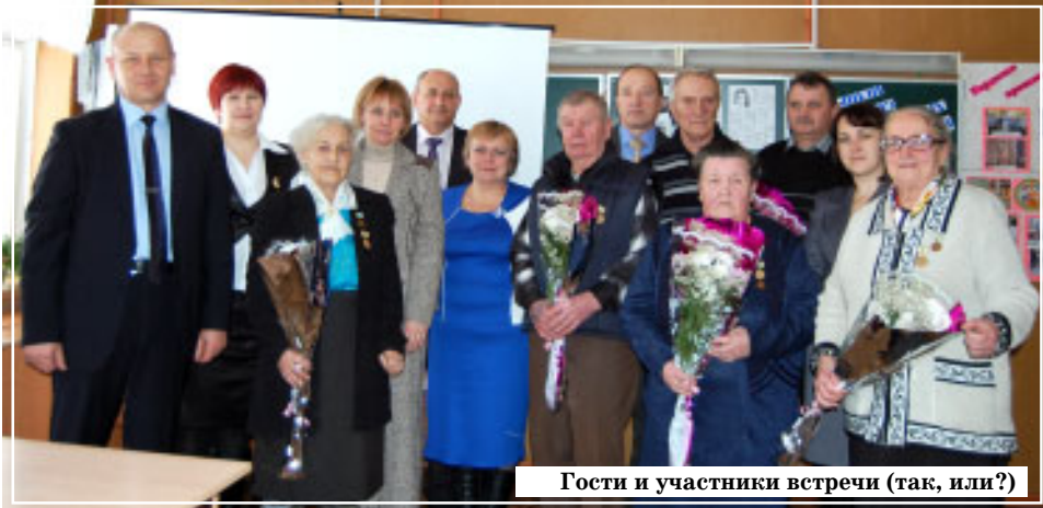
Гости и участники встречи (так, или?)

В этом году наша страна отмечала 70-летие освобождения Ленинграда из фашистского кольца. Этой дате была посвящена встреча ветеранов блокады с фировскими