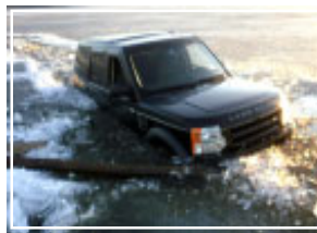
ной температурой воздуха лёд является непрочным, и выход на него очень опасен.

Налоговый вычет можно получить и при получении медицинских услуг на ребенка (например, проведение исследований на коммерческой основе, лечение у стоматолога и т.д.). Для получения данного вычета к декларации нужно приложить договор на оказание платных медицинских услуг и лицензию медицинской организации. Данный вид вычета, как и имущественный, предоставляется по окончании календарного года.