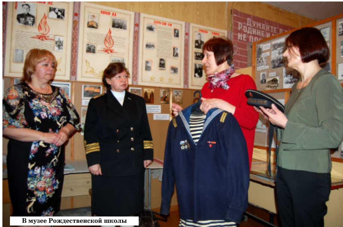
В музее Рождественской школы