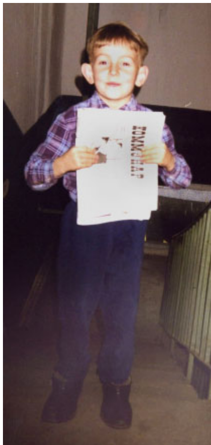
п. Фирово

В № 7 газеты «Коммунар» от 15.02.2014 г. стартовал фотоконкурс «Наша газета», который будет продолжаться весь нынешний год. Ждем новых участников!