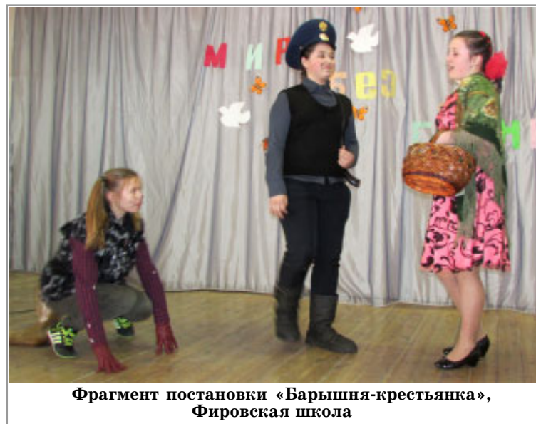
Фрагмент постановки «Барышня-крестьянка», Фировская школа

- Да, Катюша, здесь на протяжении всего фестиваля чувствовалась вкус и запах поэзии родного русского народа, отражалась вся человеческая жизнь с ее радостными и страшными, удивительными и смешными событиями. Все увлекало так, как будто это происходило на самом деле, сегодня. Даже заведующая методическим каби-