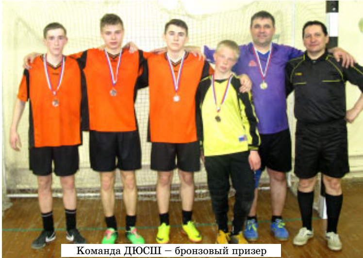
Команда ДЮСШ – бронзовый призер

В третьем игровом туре были окончательно распределены призовые места. Встреча между командами "Ветеран" и "Победа" в основном прошла в