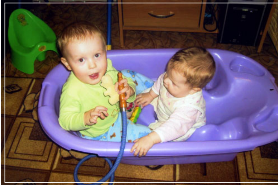
«Большому кораблю – большое плаванье»