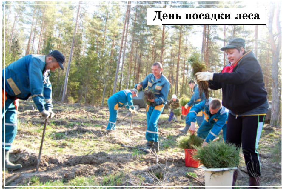
День посадки леса