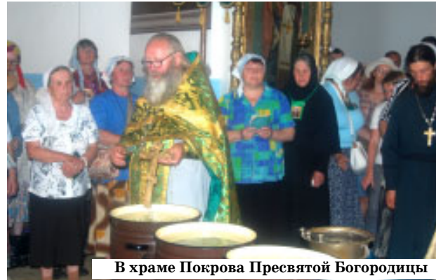
В храме Покрова Пресвятой Богородицы