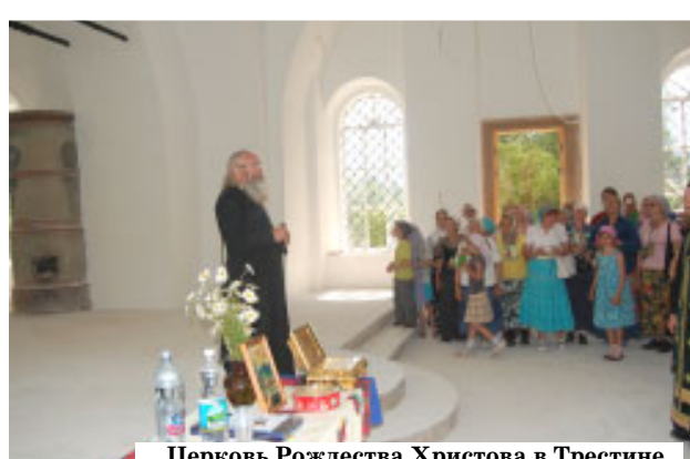
Церковь Рождества Христова в Трестине