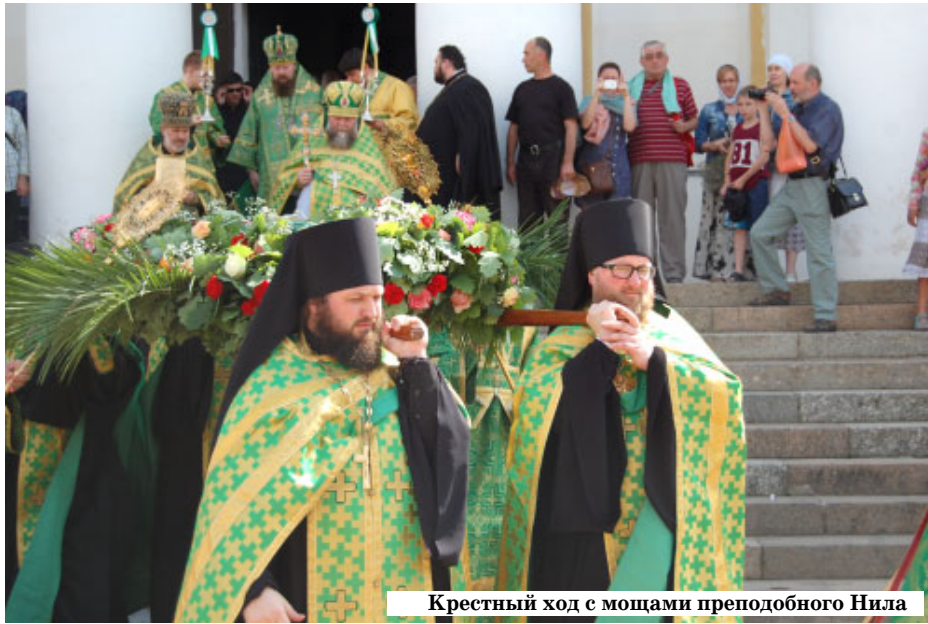
Крестный ход с мощами преподобного Нила