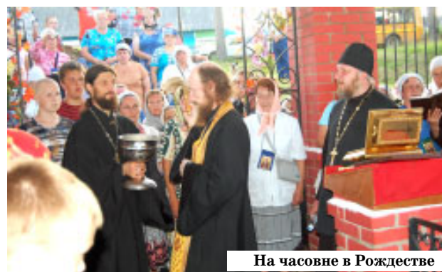
На часовне в Рождестве