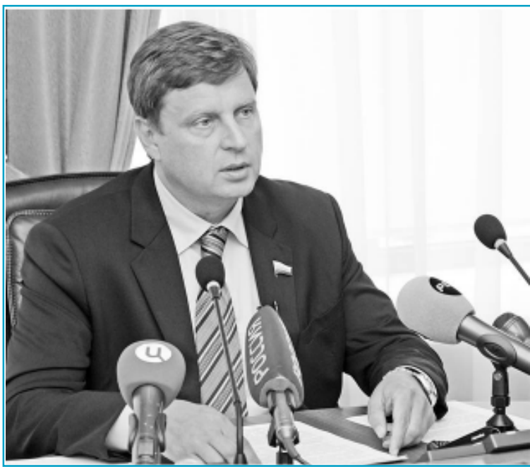
Председатель Законодательного Собрания Тверской области Андрей Епишин на итоговой пресс-конференции

Бизнес-сообщество активно поддержало саму идею введения такой должности еще на стадии законопроекта.