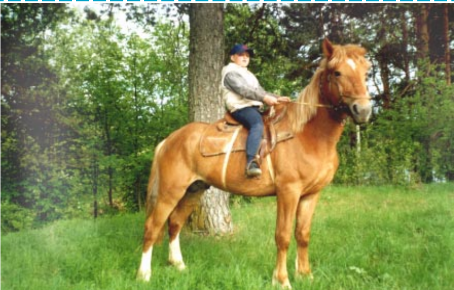
Сяду я верхом на коня...