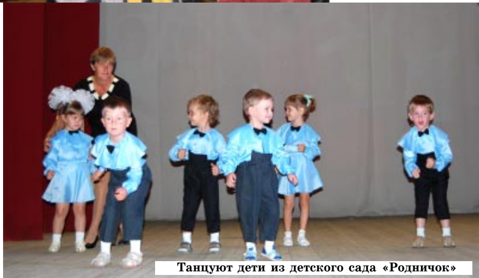
Танцуют дети из детского сада «Родничок»