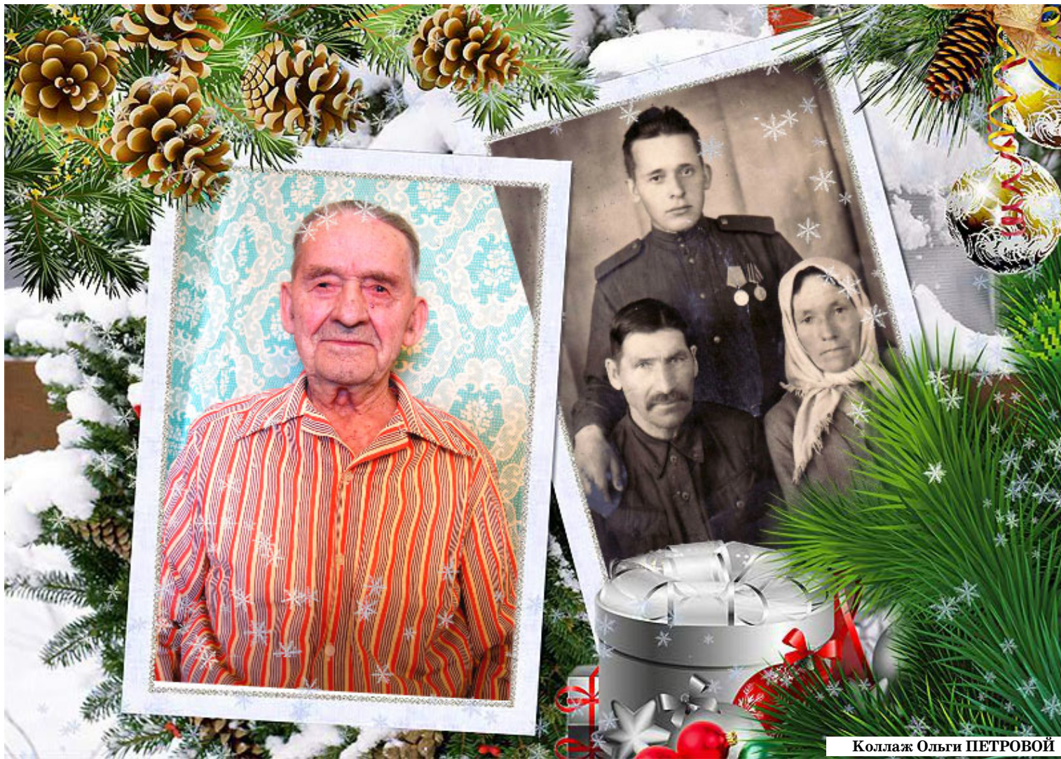
Коллаж Ольги ПЕТРОВИЧ