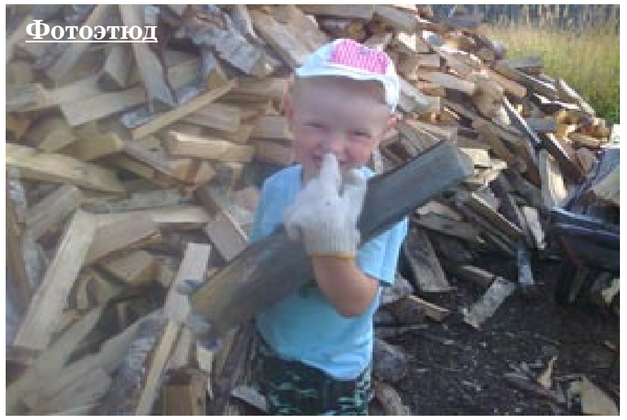
Отец, слышишь, рубит, а я отношу.