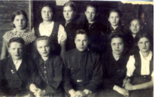
Комсомольцы Пухтиногорской семилетней школы. Март 1945 г.

Полученные за выполненную работы деньги — после сдачи льготности на завод — израсходовали на выписку газет для красного уголка и правления колхоза. Оставшихся средств хватило на то, что колхоз заплатил за комсомольцев налог... от дохода.