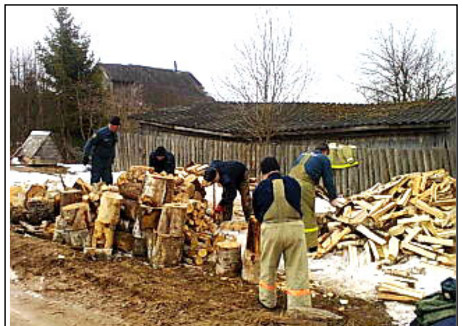
Коллектив Фировского гарнизона ПЧ-56 оказывал помощь ветеранам в распилке и расколке дров (на снимке: коллектив пожарной части №56 занят на пилке и расколке дров двум жителям Фирова).

Всего медицинскую консультацию и лечение получили 60 человек, из них